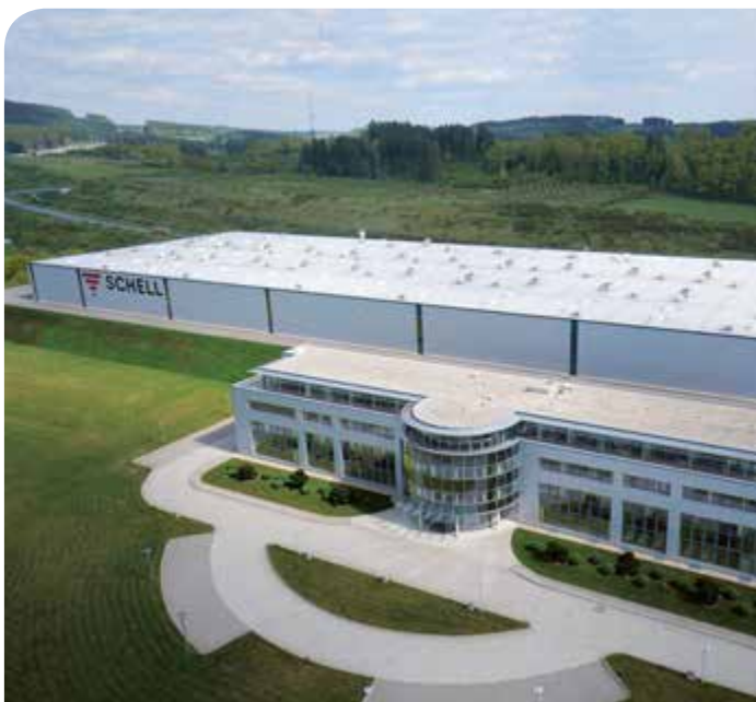
Planta 1 – Planta de producción con edificios administrativos y centro de formación