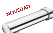
Grifería mural electrónica MODUS E