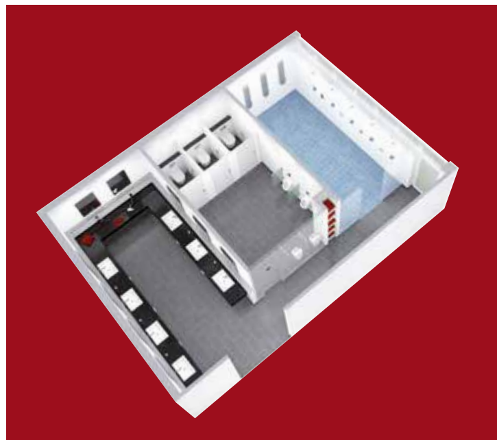
Todas las griferías para espacios sanitarios públicos, semipúblicos, comerciales e industriales