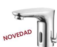
Grifería de lavabo electrónica MODUS E