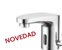
Grifería de lavabo electrónica MODUS Trend E