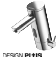
Grifería de lavabo electrónica PURIS E