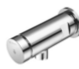
Grifería mural temporizada PETIT SC