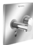
Grifería de lavabo electrónica empotrada LINUS E