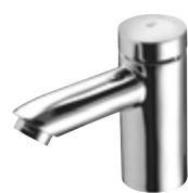
Grifería de lavabo temporizada PETIT SC HD-K