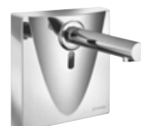
Grifería mural electrónica WALIS E