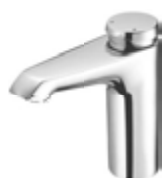
Grifería de lavabo temporizada XERIS SC