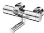
Grifería de lavabo electrónica adosada VITUS VW-E-T