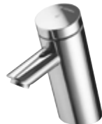
Grifería de lavabo temporizada PURIS SC