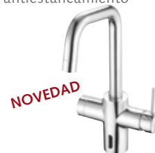
Grifería de cocina electrónica GRANDIS E