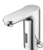
Grifería de lavabo electrónica CELIS E