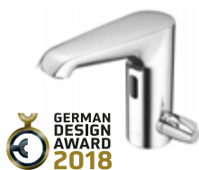
Grifería de lavabo electrónica XERIS E-T