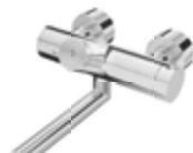
Grifería de lavabo electrónica adosada VITUS VW-C-T